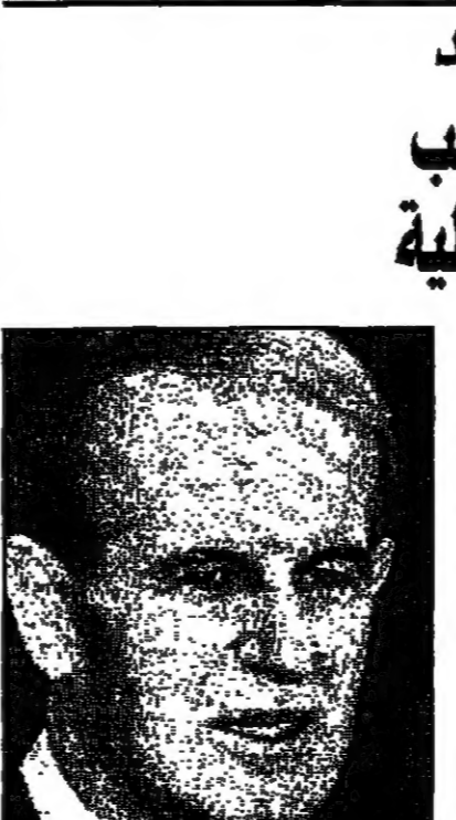
حافظ الأسد غضب النظر منه استجاب من الوقت لبقاء التفتيح خارج دائرة التفاوض

اجتمعت لجنة متابعة تطبيع تفاهات عناقيد الغضب في جنوب لبنان 15 مرة منذ اب (أغسطس) 1996، وتعتبر هذه فترة جهود المفاوضات بين الفلسطينيين وصورية نقطة الالتقاء الوحدية بين اطراف اوساط اللجان السورية وعسكرية رسمية. وقد اجرت مجلة مهامها، ماثلة مع مندوب اسرائيل في هذه اللجنة المبعوث ديفيد نيسون وفي ما يأتي منها: في كبريت الارل (ديسمبر) وبعد اصابة مارونين ليتانيين في قرية تينين، اعان حزب الله ان يحترم الاتفاقيات.